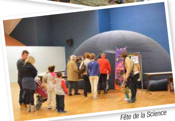
Fête de la Science