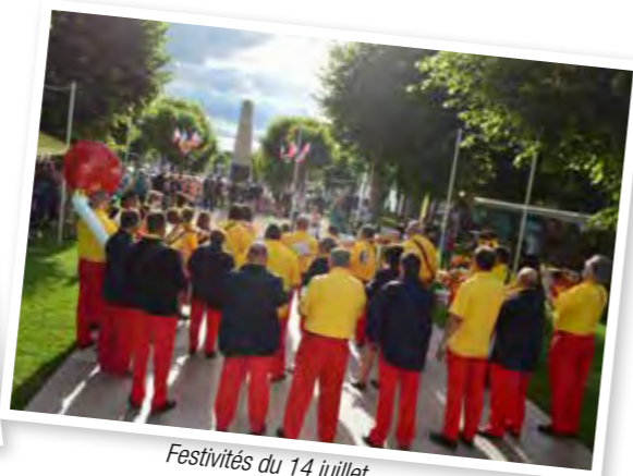
Festivités du 14 juillet