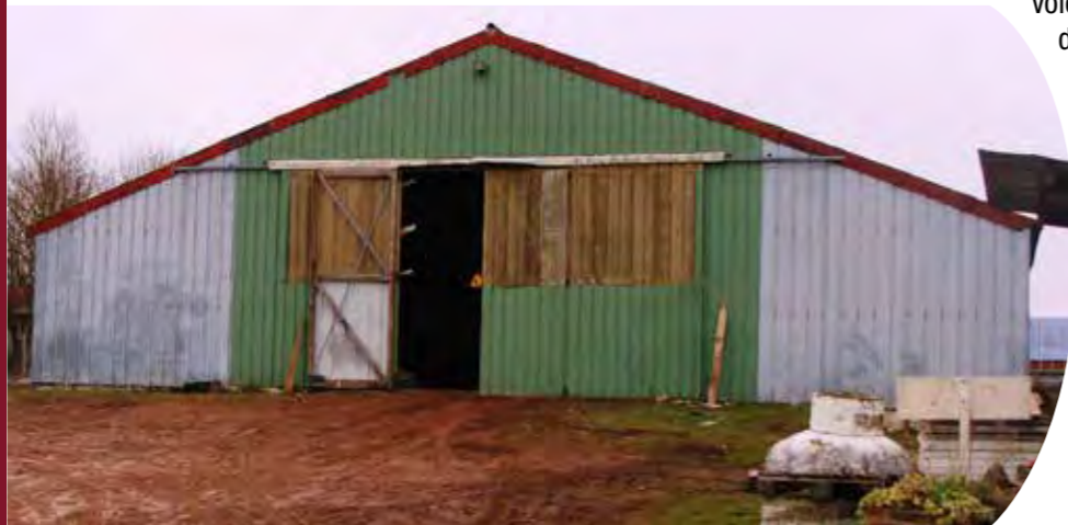
Les nouveaux locaux des services techniques sont en cours d'aménagement

Comme vous pouvez le constater, le conseil municipal ne s'est pas contenté de satisfaire une volonté d'harmonisation du centre technique. Ce projet de déménagement des services techniques s'est construit dans la volonté de répondre à des opportunités de développement économique et dans l'exigence de ne pas accumuler des bâtiments communaux à l'abandon.