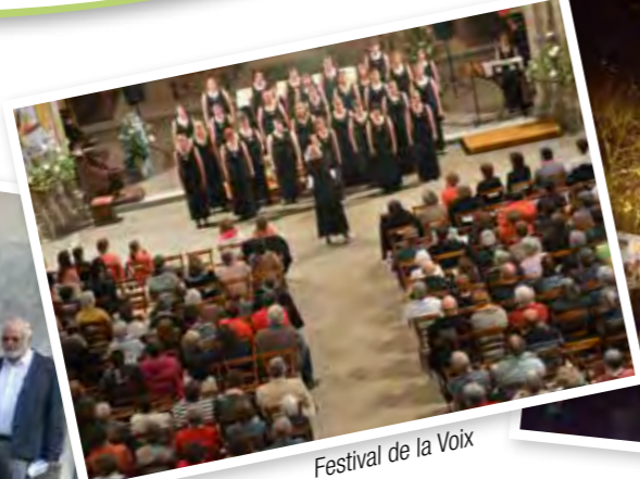
Festival de la Voix