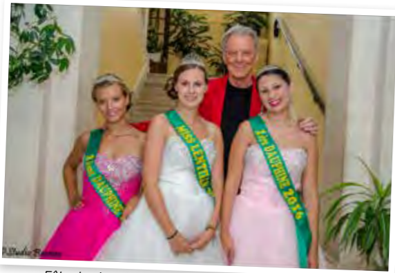
Fête des lentilles vertes du Berry