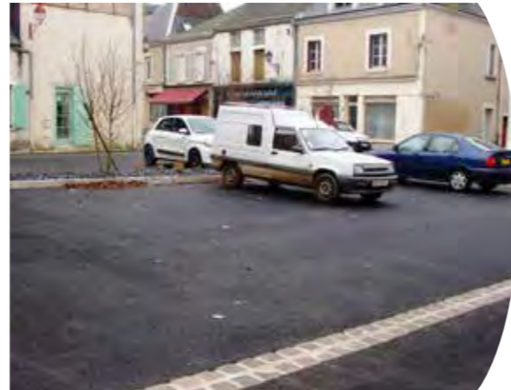
Place Florimond Dupuy