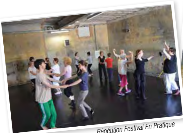
Répétition Festival En Pratique