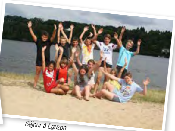
Séjour à Eguzon