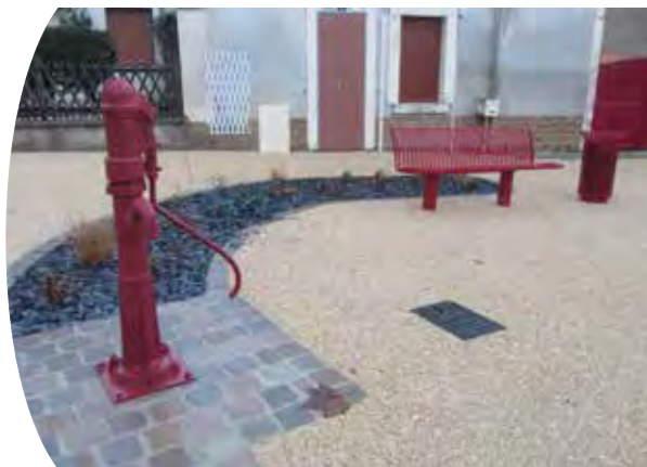
Place du Général Leclerc