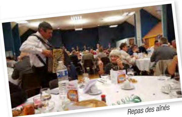
Repas des aînés