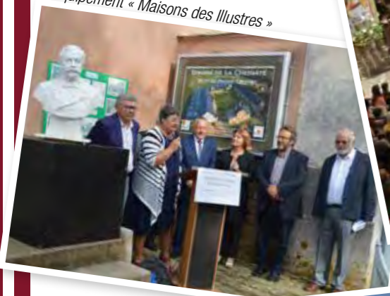
Labellisation du Musée de l'Équipement « Maisons des Illustres »