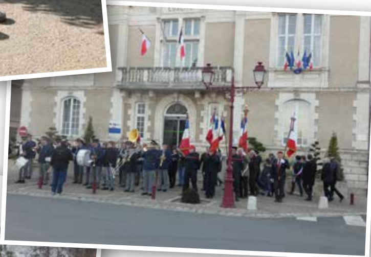
Cérémonie commémorative du 19 mars