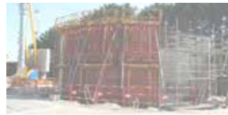
Bassin en construction