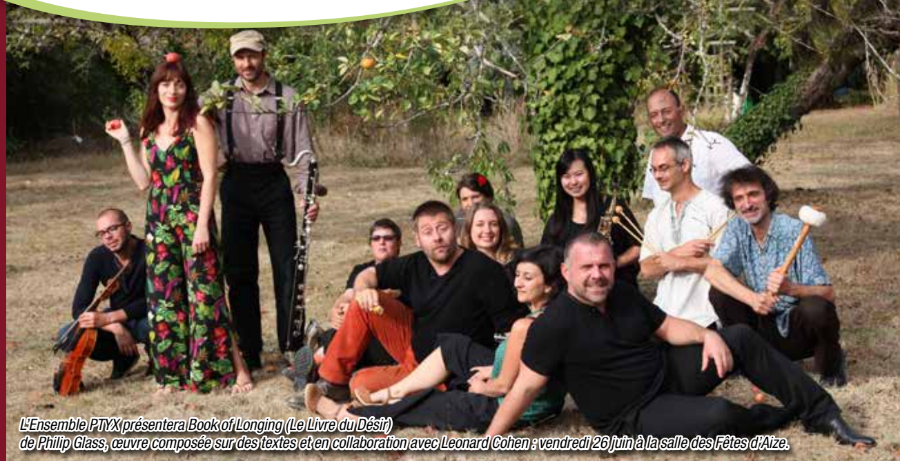
L'Ensemble PTYX présentera Book of Longing (Le Livre du Désir) de Philip Glass, œuvre composée sur des textes et en collaboration avec Leonard Cohen : vendredi 26 juin à la salle des Fêtes d'Aize.