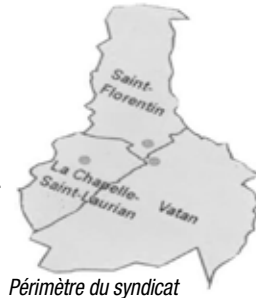
Périmètre du syndicat

Depuis le 1 er janvier 2013, le délégataire est la SAUR pour une durée de 12 ans.