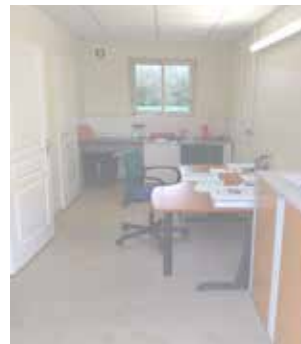
Local exploitation comprenant bureau, sanitaires et local d'analyses

Au printemps 2020, une journée porte ouverte sera organisée pour permettre à la population de découvrir la station et ses nouveaux équipements.