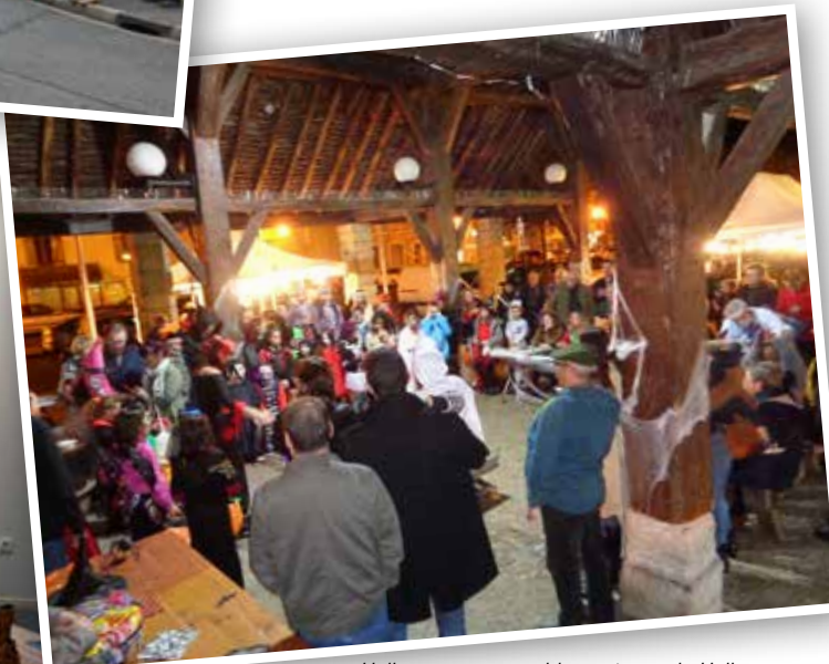
Halloween : rassemblement sous la Halle