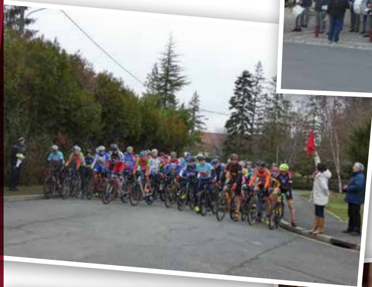
Départ Cyclocross décembre 2018