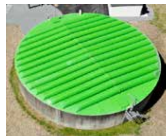
Couverture du silo à boues existant