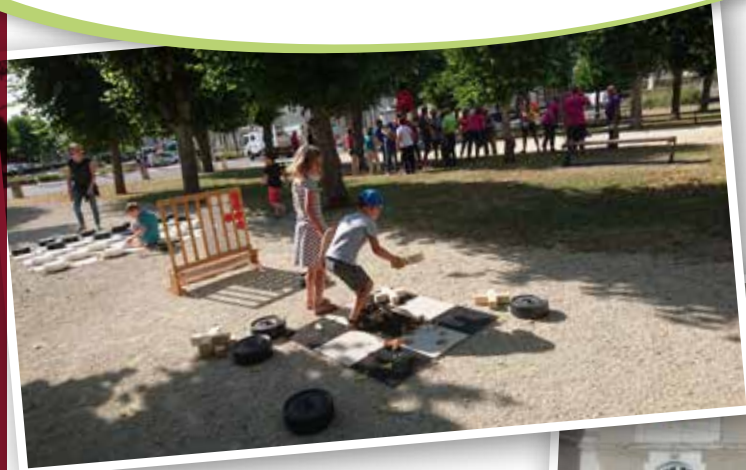
Fête Nationale : installation de jeux géants