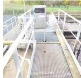
Préleveur en entrée de station

Le SATESE (Service d'Assistance Technique aux Exploitants de Stations d'Épuration de l'Indre) effectue un auto contrôle des données et de validation des analyses.