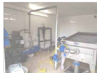
Installation d'une table d'égouttage pour épaisseur des boues

Pour compléter cette opération, un schéma directeur a été lancé en septembre. Après appel d'offre, c'est l'entreprise N.C.A. qui a été retenue pour réaliser cette étude sur une durée d'un an. Cette étude a pour objectif d'améliorer la