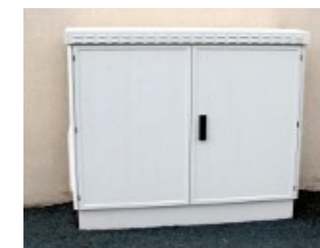
Armoire de rue

Ces fibres arrivent sur des points (boîtiers) de branchement optique (PBO) posés dans des chambres, sur des poteaux ou en façade. Un PBO permettra de desservir jusqu'à 5 abonnés. Les travaux réalisés par le RIP36 s'arrêtent sur ce boîtier de branchement situé sur le domaine public. La desserte jusqu'à l'intérieur des bâtiments se fera lorsque le propriétaire prendra un abonnement chez un fournisseur d'accès à internet présent sur le réseau fibre.